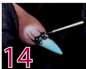
14 Till den här designen kan man använda olika färger med Nail Art Paint vid färgning av cirkelarna. Använd pensel oo från The Russian Collection när du gör de smala linjerna.