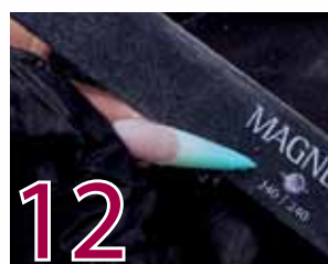
12 Fila först sidornas form med en Emery Board. Fila därefter nagelbandsområdet och förlängningen med en Boomerang Special. Håll filen plant och vertikalt på nageln och fila till längden. Fila spetsen på tippet spetsig och även underifrån för att undvika att nageln pekar nedåt. Fila slutligen nageln matt med ett White Block.