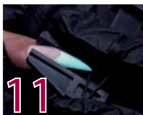
11 Fastställ formen med en Clamp Pinchingtool.