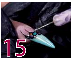
15 Avslutningsvis kan man applicera några kristallstenar för ett elegant utseende.