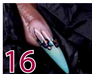
16 Avsluta naglarna med Supreme Finish för att skydda designen och skapa en vacker hög glans.